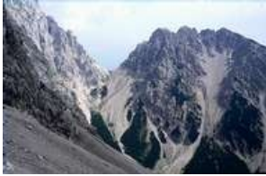
Alpines Ödland

Treten im Tirol Atlas-Gebiet "Sonstige Flächen" in nennenswertem Umfang auf, handelt es sich in der Regel um alpines Ödland. Hier ist aufgrund der niedrigen Temperaturen, der Beschaffenheit des Untergrundes oder der Steilheit des Reliefs eine Nutzung nicht oder nur unter großem finanziellem Aufwand möglich.